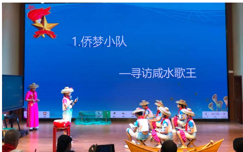
2021年6月16日,区华侨小学教师参加“喜迎建党百年 传承红色基因”2021年北海市少先队微课比赛。图为比赛现场。

【教育信息化建设】 2021年,银海区实施教师信息技术应用能力提升工程2.0整校推进工作,