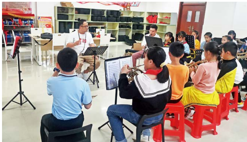
2021 年 10 月 21 日,银海区第一小学在学校开展器乐课后社团活动。

【德育工作】 2021 年,银海区重视未成年人思想道德建设,以创建“一校一品”为抓手,全面提升学校品质,北海艺术设计学院附属学校的“艺养教育”、银海区实验小学的“和美教育”等各具特色。实现中(小)学德育工作“一校一案”全覆盖,以构筑学校、家庭、社会“三位一体”未成年人思想道德教育体系为重点,持续深化“扣好人生第一粒扣子”等主题教育实践活动,3 名学生被评为市级新时代好少年。打造教育系统“三文明”创