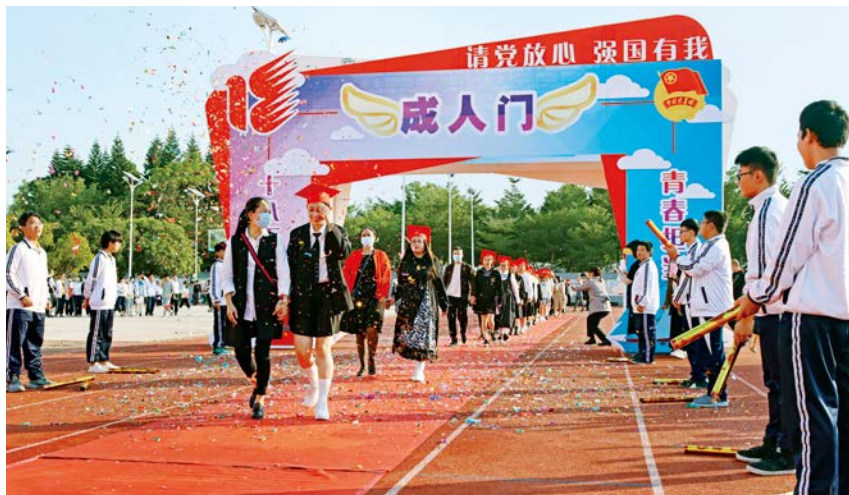
2021年12月3日,“请党放心 强国有我”2021年北海市银海区中学生18岁成人仪式暨“12·4”国家宪法日主题团日活动在银海区银滩中学举行。 区教育局供

术生考试中,23名艺术生全部超过合格线,其中2名艺术生被广西艺术学院录取。此外,银海区银滩中学素质教育结硕果,获得全国中(小)学英语能力测评二等奖3人,全国中(小)学英语能力测评三等奖2人,广西壮族自治区“云共读”优秀奖6人,银海区演讲比赛二等奖2人。年内,银海区银滩中学获北海市高中综合教学质量先进单位二等奖,被北海市教育局评为第二届北海市文明校园。