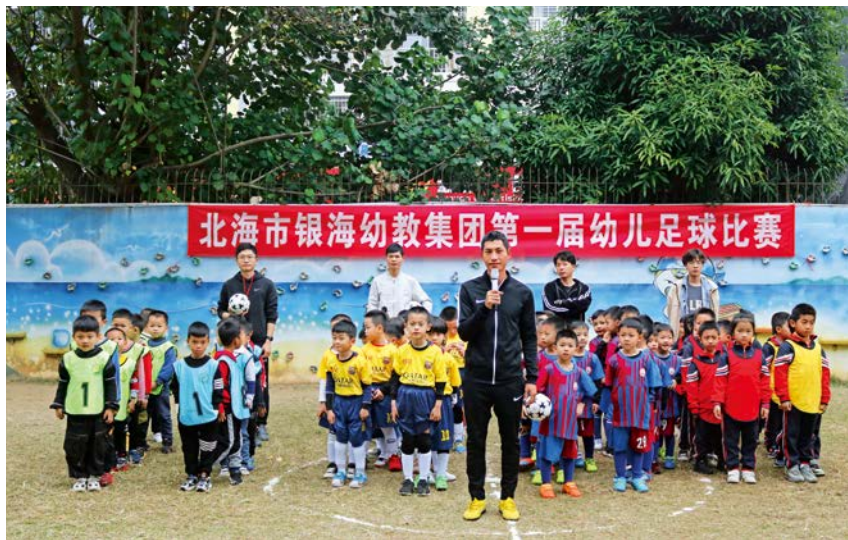
2021年11月25日,北海市银海幼教集团第一届幼儿足球比赛在银海区机关幼儿园举办。 区机关幼儿园供

快乐运动”为办园特色;平阳镇中心幼儿园以“温馨阅读、陶冶情操、孕育文化、营造满园书香”为办园特色。年内,银海区第二幼儿园、平阳镇幼儿园和福成镇幼儿园被教育部评为全国足球特色幼儿园。